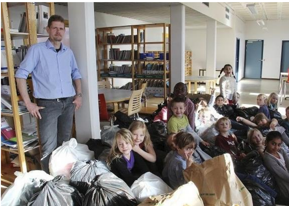
Skole smider tøjet