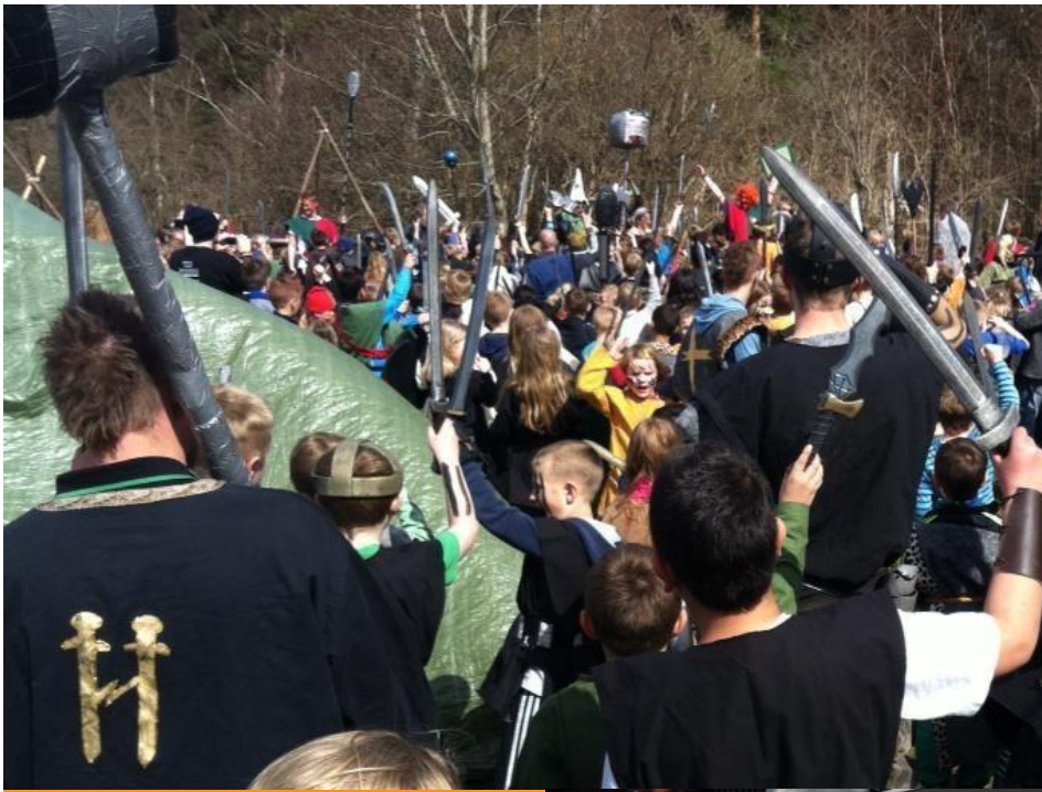
Rollespil i Vestskoven